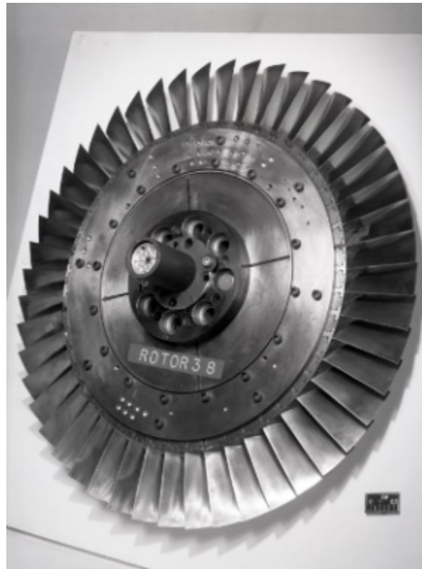
Fig. 1 https://catalog.archives.gov/id/17443470