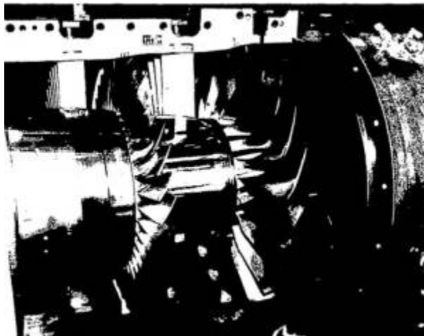
Fig. 1 https://ntrs.nasa.gov/citations/19790018972 p.119