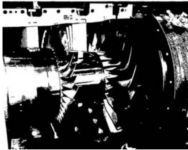
Fig. 1 https://ntrs.nasa.gov/citations/19790018972 p.119