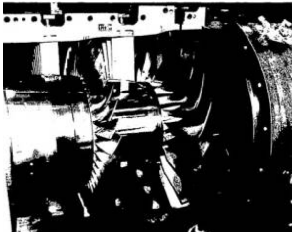
Fig. 1 https://ntrs.nasa.gov/citations/19790018972 p.119