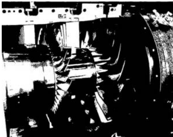
Fig1. https://ntrs.nasa.gov/citations/19790018972 p.119