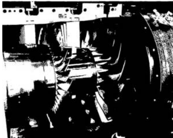
Fig1. https://ntrs.nasa.gov/citations/19790018972 p.119