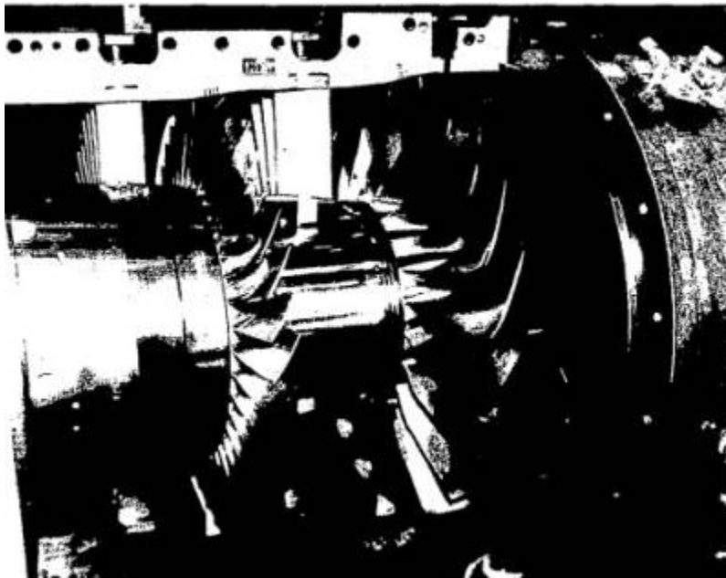
Fig1. https://ntrs.nasa.gov/citations/19790018972 p.119