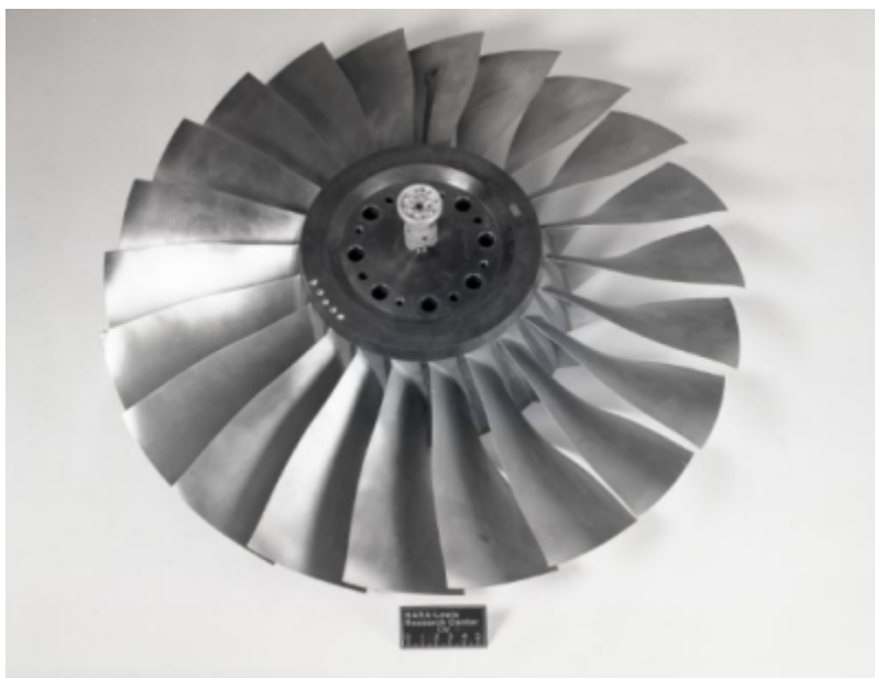
Fig. 1 https://catalog.archives.gov/id/17500556