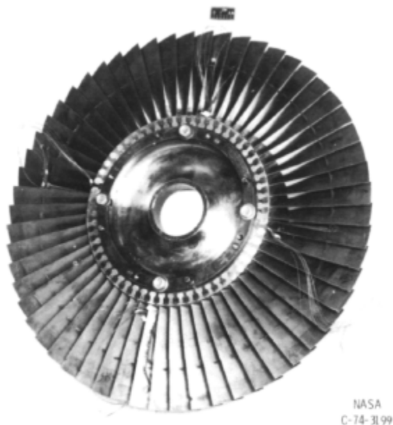
Fig. 1 https://catalog.archives.gov/id/17423368