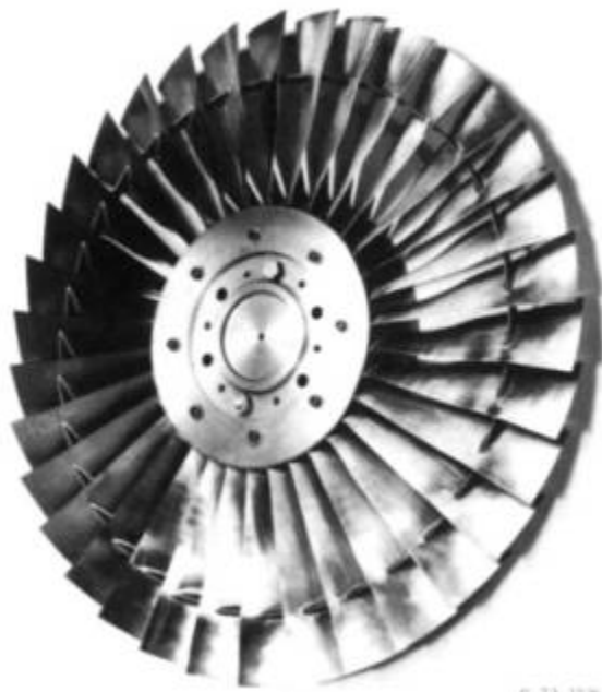
Fig. 1 https://ntrs.nasa.gov/citations/19760017065 p.114