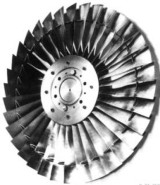
Fig. 1 https://ntrs.nasa.gov/citations/19760017065 p.114