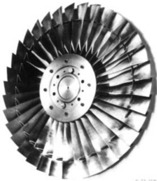
Fig. 1 https://ntrs.nasa.gov/citations/19760017065 p.114