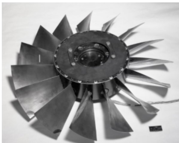
Fig. 1 https://catalog.archives.gov/id/17426841