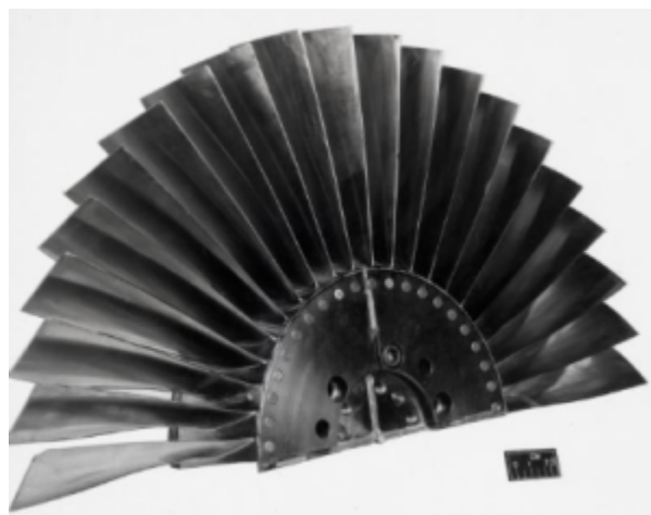
Fig. 1 https://catalog.archives.gov/id/17444857