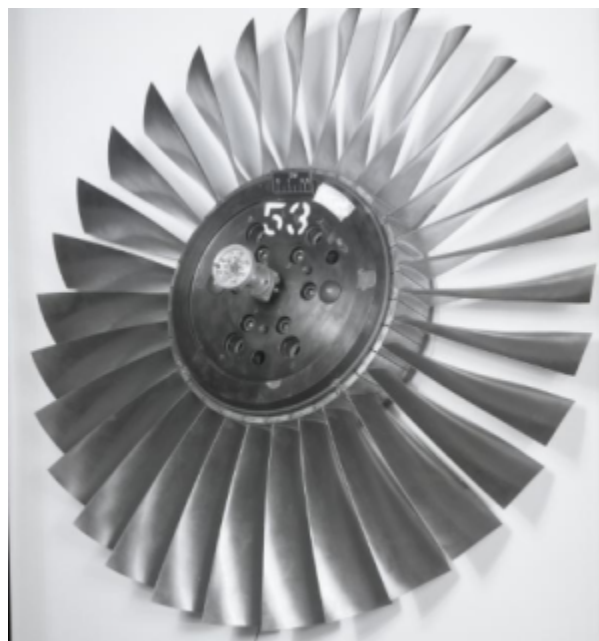
Fig. 1 https://catalog.archives.gov/id/17423389