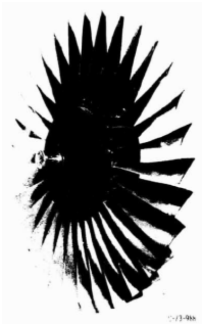
Fig. 1 https://ntrs.nasa.gov/citations/19740026337 p.87