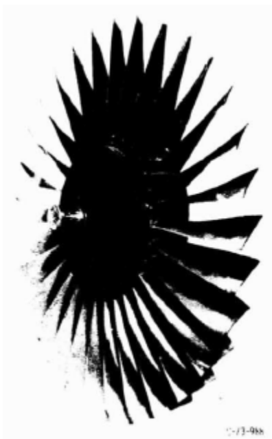
Fig. 1 https://ntrs.nasa.gov/citations/19740026337 p.87