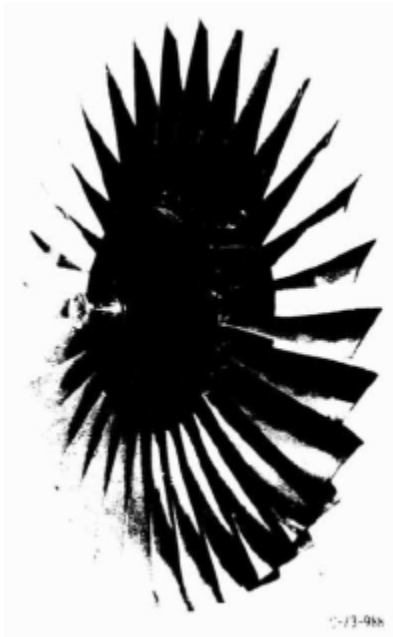
Fig. 1 https://ntrs.nasa.gov/citations/19740026337 p.87