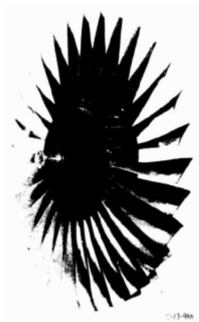
Fig. 1 https://ntrs.nasa.gov/citations/19740026337 p.87