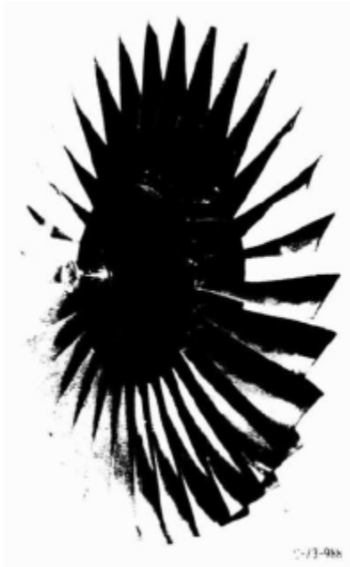
Fig1. https://ntrs.nasa.gov/citations/19740026337 p.87