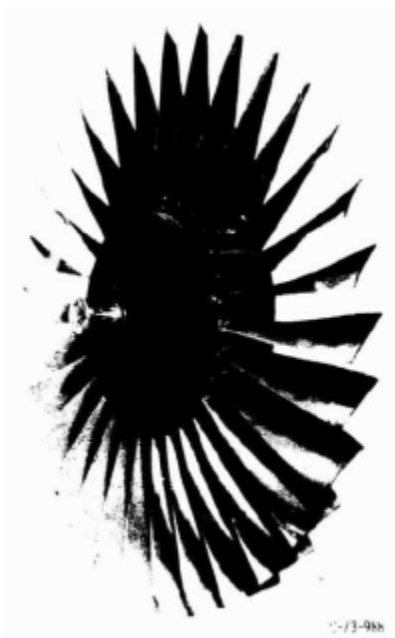
Fig1. https://ntrs.nasa.gov/citations/19740026337 p.87