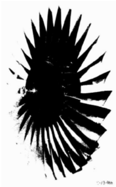
Fig1. https://ntrs.nasa.gov/citations/19740026337 p.87