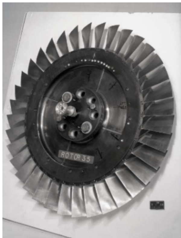
Fig. 1 https://catalog.archives.gov/id/17466807