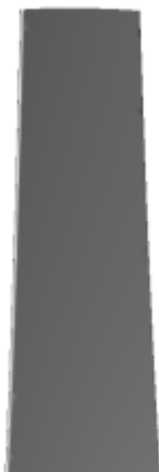
└ pressure side

The CAD model is computed with the open source code OpenMCAD [2] .