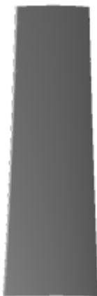
└ suction side