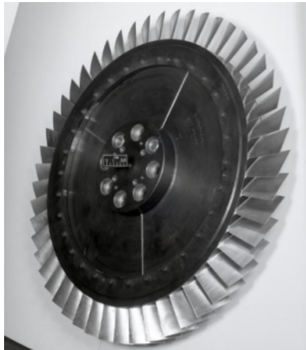
Fig 1. https://catalog.archives.gov/id/17446275